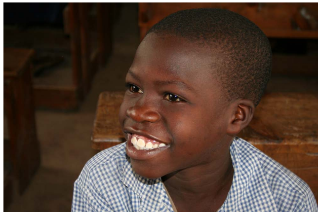
Puhdas ja kylläinen