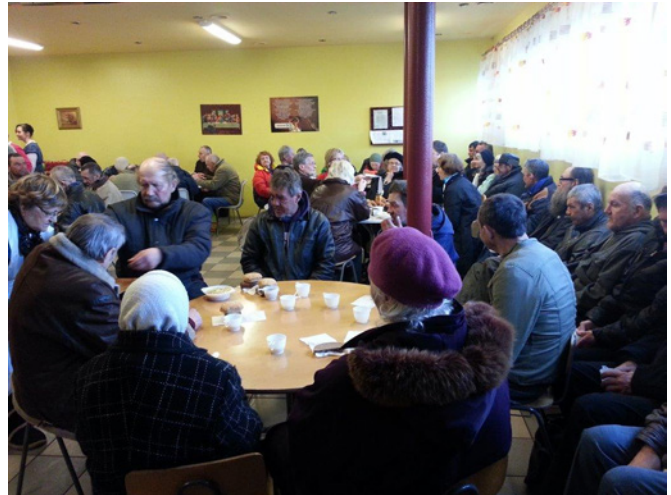
Tallinnassa paikalliset seurakunnat yhteisvoimin jakavat säännöllisesti soppaa kodittomille. RN-järjestö on mukana auttamassa.

”Siunattu se, jolla on hyvä sydän, hän antaa leivästään tarvitsevalle.” (Snl 22:9)