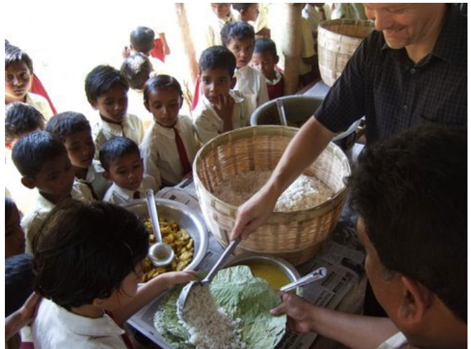
Odotetun ruokatunnin aika

”Sallikaa lasten tulla minun luokseni, älkääkä estäkö heitä, sillä heidän kaltaistensa on Jumalan valtakunta.”