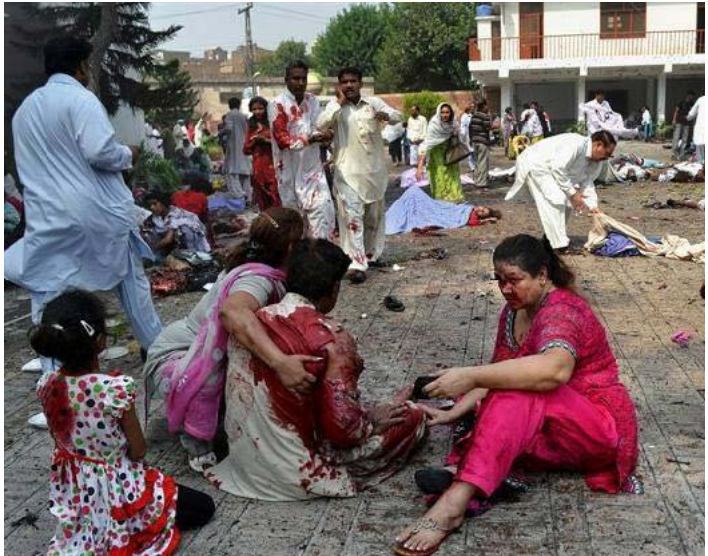
Offren för de två bombattentaten var de kristna.