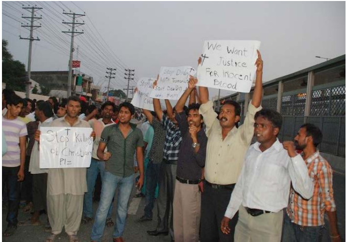
Genom demonstrationer krävs ett slut på bombdåden.