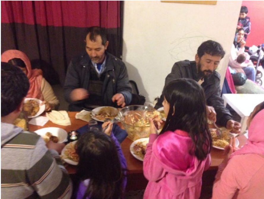
Under juni och juli anlände över 1000 flyktingar till Grekland per dag.

Till Greklands kust har detta år redan kommit ca 124 000 flyktingar, i huvudsak sådana som flyr på grund av konflikterna i Mellanöstern.