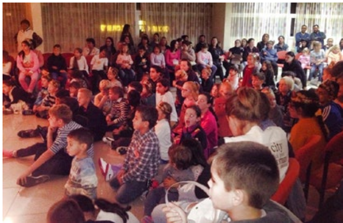
Ensamförsörjarnas och flyktingarnas barn, som vi försöker hjälpa i Ashdod, är ca 300.

Gilla oss på FaceBook och du stöder de hungrande www.facebook.com/ruokkikaa.nalkaiset