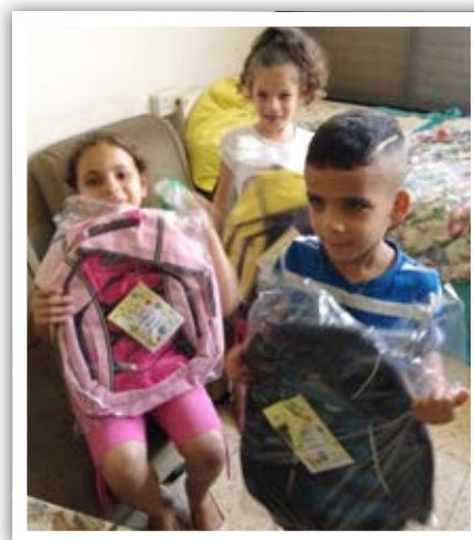
Egen ryggsäck och skolmaterial motiverar till studerandet. Vad skall det bli av dem?

kvällar för bekantskap i samband med judarnas fest, och dit samlas hundratals personer. Som avslutning på kvällen får deltagarna paket fyllda med mat och hygienartiklar att ta med sig hem. Beit Hallel-församlingen ordnar även bussresor till heliga platser,