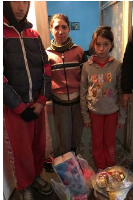
Den här familjens trångmål började när pappan blev blind, din gåva har hjälpt dem att överleva.