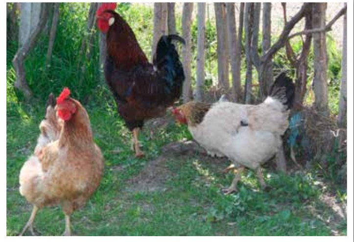
Tack vare RN givarnas regelbundna gåvor springer det en flock nya kycklingar på gårdarna i byarna nära Lushnje. De ger dagligen extra mat för familjerna.

Augusti 2017 förblir som en mörk tidsperiod i Albanien historia. Efter en exceptionellt het sommar härjade över 80 skogsbränder i landet och förstörde många hem. Det finns inget nationellt socialskyddssystem i Albanien som kunde fungera som skyddsnät i kristider. Förra sommaren blev många albaner urfattiga. Trots att livet i Albanien är ekonomiskt väldigt begränsat över allt, fanns det hjälp att få i församlingen. Samarbetsförsamlingen Fjala e Jetes mobiliserade sina frivilliga arbetare att hjälpa dem som förlorat sina hem. Man erbjöd människorna härbärge i nöden, mat- och klädhjälp samt mental och andlig krishjälp.