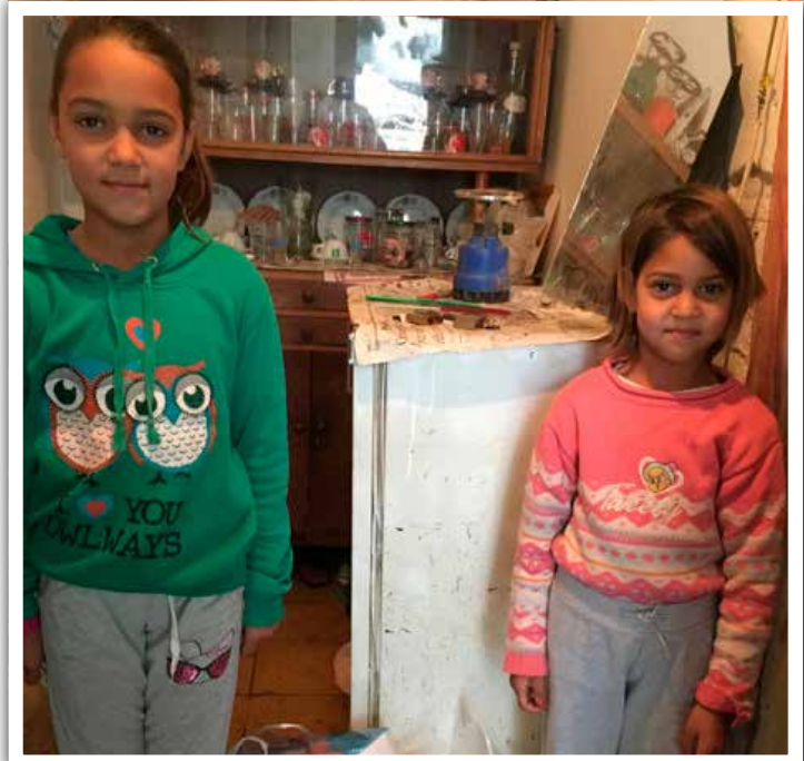
Isä kuoli ja neljä pikkutyttöä jäi köyhän mummon hoiviin. Sinun lahjasi turvin näille sisaruksille vietiin ja viedään ruokaa sekä elävää toivoa.

Ruokkikaa Nälkäiset on rahoittanut Fjala e Jetes-seurakunnan diakoniatyötä vuodesta 2010 alkaen kanavoiden lahjoitukset järjestön mission mukaisesti nimenomaan ruoka-apuun. Samalla jaetaan evankeliumia. Kaikkensa menettäneille toivon syyttäminen ja kokemus ihmisten välittämästä Kristuksen rakkaudesta on äärimmäisen kallisarvoista.