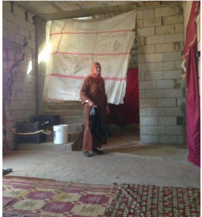
RN-järjestö ostaa patjoja, ettei pakolaisten tarvitse nukkua lattialla.