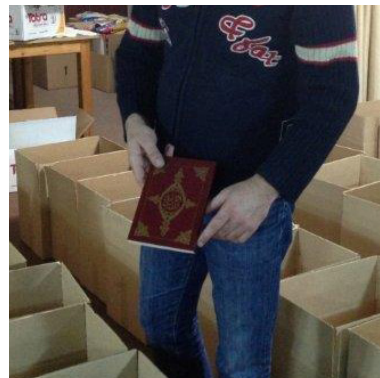
Jokaisesta ruokapaketista löytyy ruoan lisäksi myös Raamattu.

”Kehoita heitä tekemään hyvää, keräämään rikkaudekseen hyviä tekoja ja jakamaan anteliaasti omastaan muille. Näin he kokoavat itselleen aarteen, hyvän perustuksen tulevaisuutta varten, niin että voittavat omakseen todellisen elämän. (1 Tim 6:18-19)