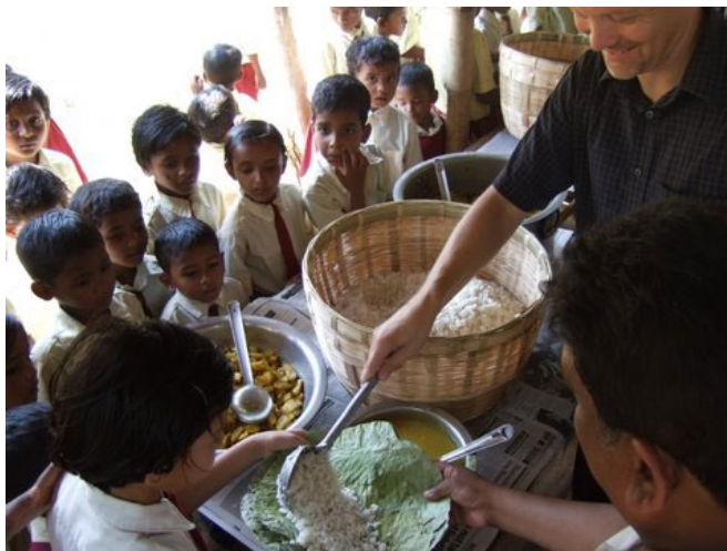
Tid för den efterlängtrade matpausen

Låt barnen komma till mig och hindra dem inte. Ty Guds rike tillhör sådana. (Mark 10:14)