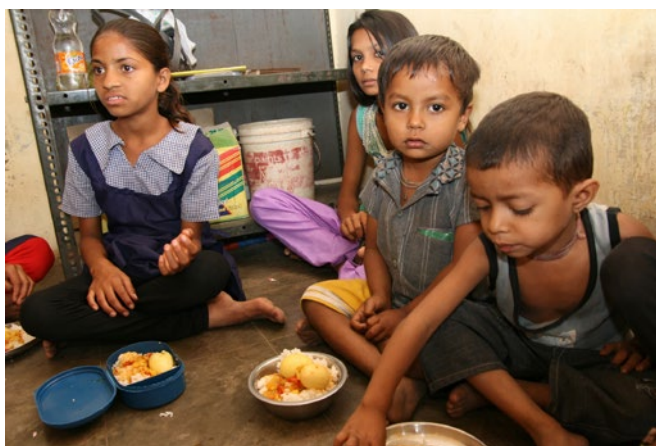
En omtyckt ägg-måltid

Läraren berättade om en liten pojke som älskar ägg. Han vill absolut ha två ägg. Läraren förklarade att man först delar ut ett ägg åt alla och därefter får han ett till, om det finns kvar. Pojken hade svaret direkt: "Om du inte ger mig två ägg, så ger Jesus inte ett enda till dig!"