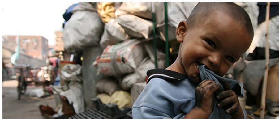
Förutom skolluncherna delar Mätta de Hungrande mjölk till 100 små barn i slumområden i Nadia.

Gilla oss på FaceBook och du stöder de hungrande www.facebook.com/ruokkikaa.nalkaiset