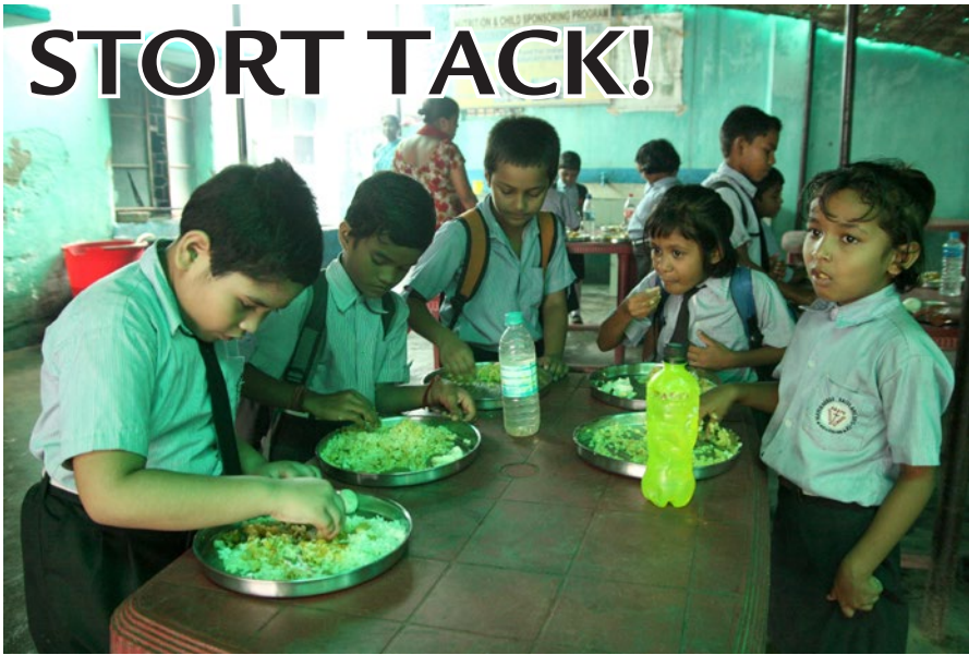
För de flesta barnen är skollunchen dagens enda måltid.

Mätta de Hungrande r.f. vill tacka dig, kära understödjare, för de gåvor du skickat regelbundet. Det anlända biståndsmaterialet har sänts vidare och har redan kommit fram till de hjälpbehövande.