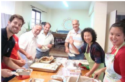
Tiimiläisiä tekemässä ateriapakkauksia Ateenan puistossa majoittuville.

RN-ruokaa jaetaan neljästi viikossa Ateenassa Samaria-avustuskeskuksessa. Lisäksi Ateenan puistoissa jaetaan apua siellä majoittuville.