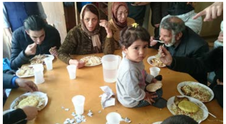
Lämmintä ruokaa saa Samaria-keskuksessa neljänä päivänä viikossa.