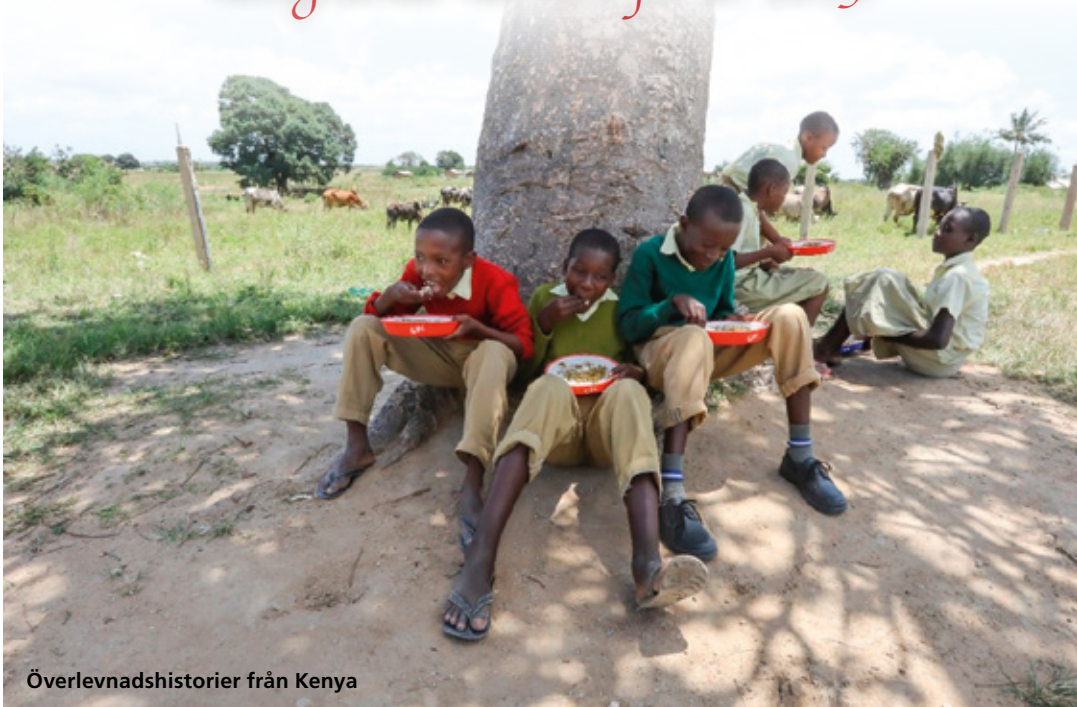
Överlevnadshistorier från Kenya

RN tackar för samarbetet under det gångna året 2018 och önskar dig Fridfull jul och Vår Himmelske Faderns välsignande närvaro för år 2019!